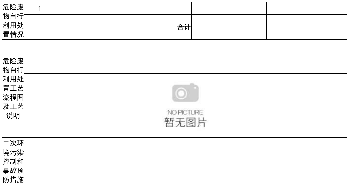
表 7 危险废物委托利用/处置措施（可另增页）